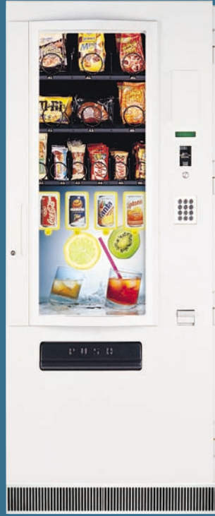
COMBI S LUX