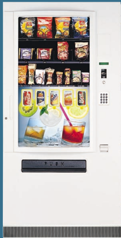
COMBI M LUX