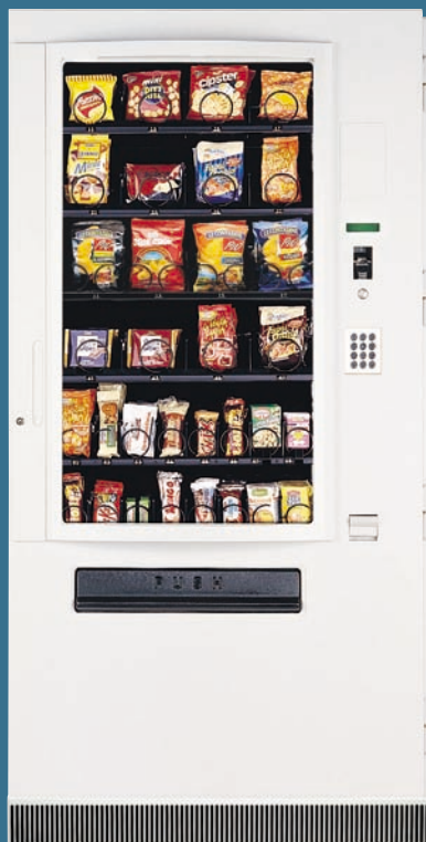
SPIRALE M LUX