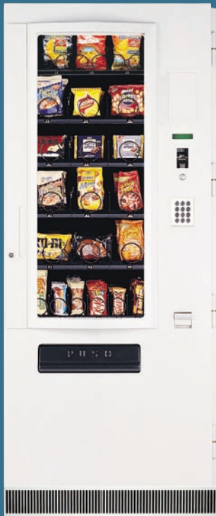
SPIRALE S LUX